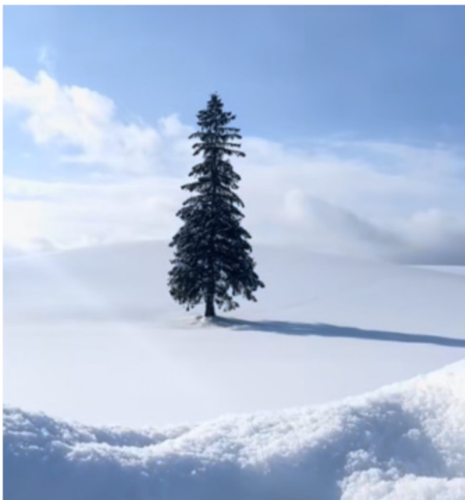
▼ 네이버 빨간 망토 차차의 러브데이 이미지