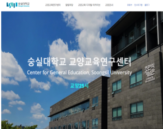
▲ 교양교육연구센터 홈페이지 메인 화면

교양교육연구센터는 저희 송실공동교양체가 소속된 곳이기도 한데요, 송실대학교의 교육목표와 인재상에 부합한 교양교육 과정의 개발과 기독교적 건학이념 구현을 위한 인성함양 교육 프로그램 연구를 통해 대학 기초교양의 발전에 기여하는 것을 목적으로 설립되었습니다. 교양교육연구센터는 건학이념에 부합한 대학생 인성함양 교육을 위해 관련 교과목 및 비교과 프로그램 개발을 지원하고, 핵심역량에 기반을 둔 교양교육 과정의 주기적 개선을 위해 교양 교과목 개선 및 신규 교과목 개발을 지원하고 있습니다.