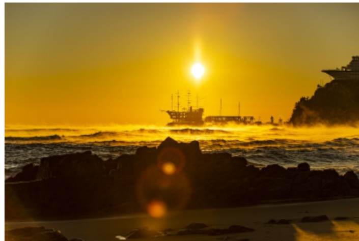
▼ 네이버 펫해피 이미지