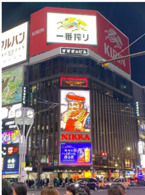
▼ 네이버 두티의 건강한 하루 이미지