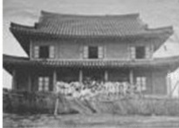
평양의 송실학교 1891년 SoongSil School in PyongYang