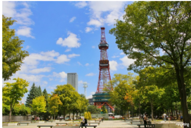
▼ 네이버 밍스랜드 이미지